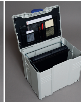
Doku-Koffer mit Laptop